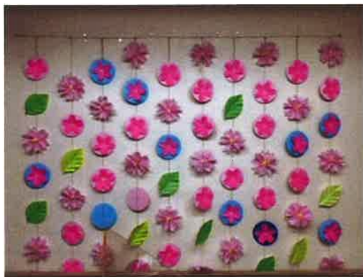
↑利用者さんと作成した壁面飾りです。